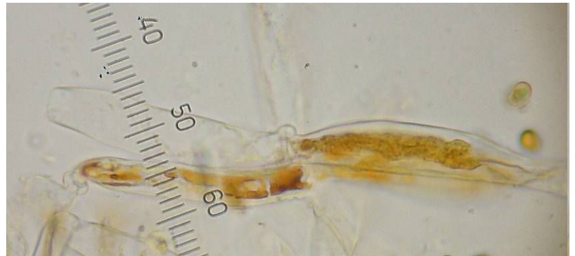
傘表皮末端細胞(水封入)